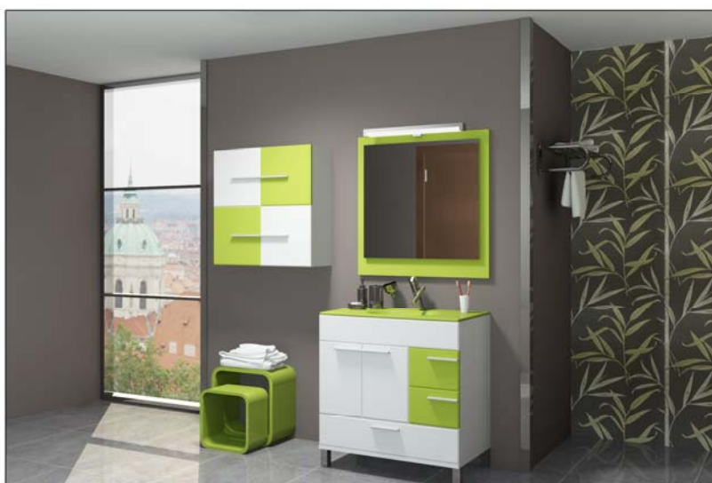
imagen realizada con TeoWin

Esta nueva herramienta tiene el nombre de Impresión Avanzada y permite imprimir más de una imagen en el mismo folio, pudiendo seleccionar entre varias plantillas de impresión predefinidas y varios pies de página .